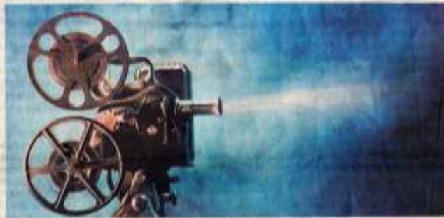
Projecting progress: The industry's revenues are expected to touch $3.7 billion by 2020, according to the study.

The Indian film industry had the second highest footfalls in the world in 2015