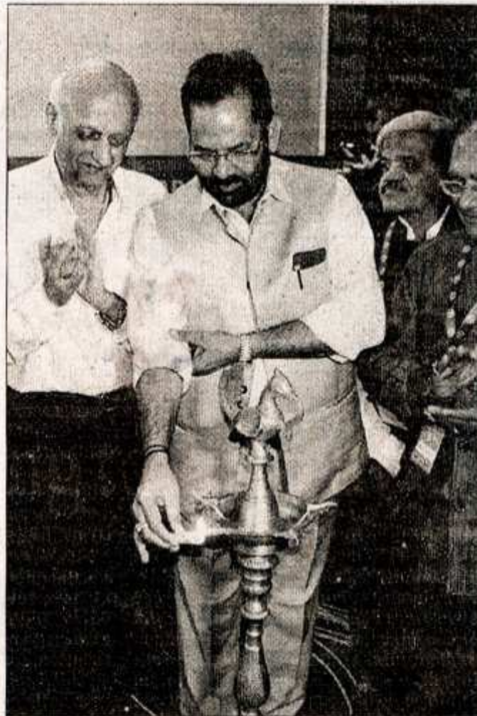
Union Minister for Minority Affairs Muqtar Abbas Naqvi lighting the lamp to inaugurate the 'Global Film Tourism Conclave', organized by PHD Chamber of Commerce and Industry in Mumbai on Saturday.